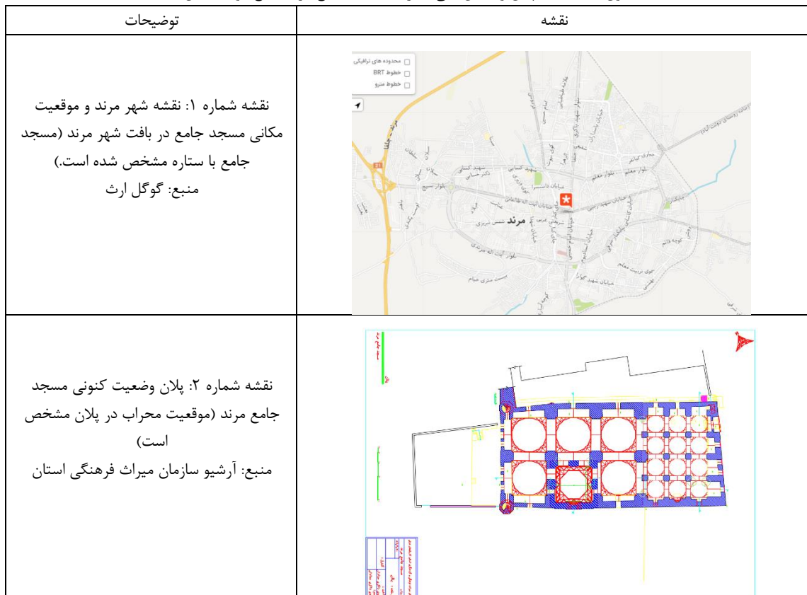
جدول ۲: نقشه‌ها، پلان و عکس کلی محراب مسجد جامع مرنده (منبع: نویسندگان)

در مطالعات صورت گرفته مشخص گردید برخی از کتیبه‌های محراب خوانده نشده و یا ناقص قرائت شده‌اند لذا در این پژوهش سعی خواهد شد با عکاسی دقیق و مطالعه بر روی کتیبه‌ها، متن اصلی آنها استخراج شود. به طوریکه در تصاویر نیز مشخص است قسمتهایی از کتیبه‌ها از بین رفته‌اند (مخصوصاً در قسمتهای پایه)، لذا با استخراج و خوانش دقیق کتیبه‌ها، امکان احیای قسمتهایی از سطوح تخریب شده (با رعایت ضوابط و قوانین مرمتی) ممکن خواهد بود.