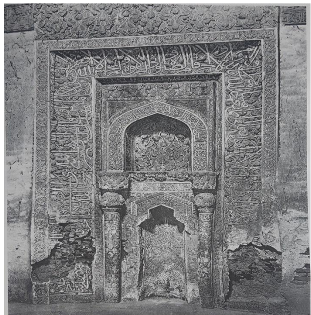
عکس ۲: محراب مسجد جامع مرند (بر اساس شواهد، این عکس در دهه‌های سوم یا چهارم قرن بیستم توسط پوپ گرفته شده است.)

در رابطه با کتیبه شماره ۴ لازم به توضیح است که در مرمت‌های اخیر قسمتی از یک کتیبه در جهت افقی در ابتدای پایینی کتیبه شماره یک از زیر لایه‌های گچ الحاقی به دست آمد که عبارت «رسول الله صلی» قابل قرائت بود. با خوانش کتیبه شماره ۴ که در برگزیده‌ی حدیثی نبوی است مشخص گردید بر خلاف سایر احادیث قید شده در محراب محلی برای ناقل حدیث وجود ندارد. همچنین در انتهای این کتیبه که حدیث دیگری از پیامبر خدا (ص) در آن نوشته شده، برای سه واژه‌ی انتهایی محلی باقی نمی‌ماند. با جمیع اطلاعات مشخص گردید که بر خلاف سایر کتیبه‌ها و اشکال رایج، این کتیبه از کرسی ابتدایی کتیبه شماره ۱ شروع و پس از چرخش نود درجه در مسیر عمودی و در مجاورت زیرین همین کتیبه حرکت کرده و پس از رسیدن به انتهای عمودی مقابل، با چرخش نود درجه مجدداً در قسمت زیرین کتیبه شماره ۱ مسیر افقی را طی نموده و به پایان می‌رسد. (رنگ نارنجی در تصویر جدول شماره ۲) عکس گرفته شده توسط پوپ که در جلد هشتم کتاب «سیری در هنر ایران، از دوران پیش از تاریخ تا امروز» چاپ شده است، نیز این فرضیه را تصدیق نمود.