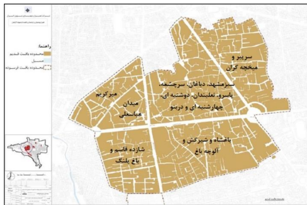
نقشه ۲: محدوده عملکردی امروزی محله دربنو و دیگر محلات قدیمی گرگان