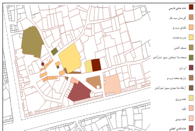
نقشه ۳: معرفی عناصر شاخص تاریخی و معماری محله دربنو