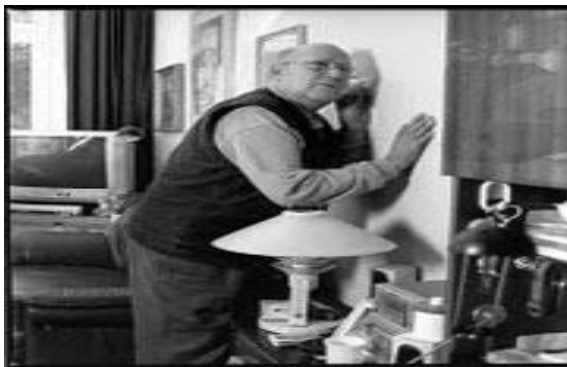
تصویر شماره ۴- فقدان اخلاق آپارتمان‌نشینی