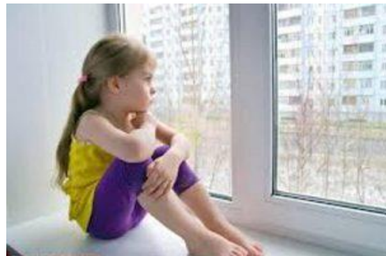
تصویر شماره ۳- کوچک شدن خانواده‌ها