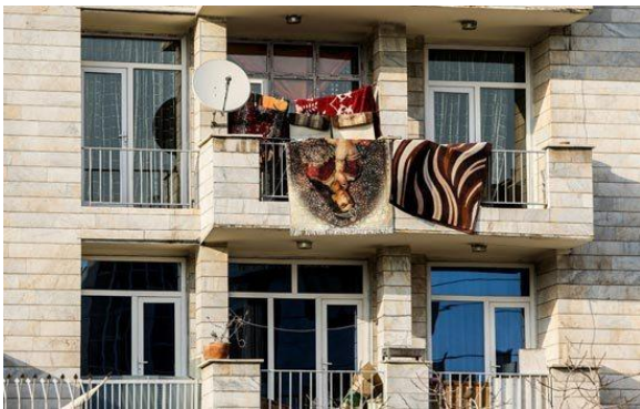
تصویر شماره ۲- تعارضات آپارتمان‌نشینی با سبک زندگی اسلامی (محمدی، ۱۳۹۴)

هرچند از استقرار بخش قابل توجهی از جمعیت کشور در واحدهای آپارتمانی سال‌ها می‌گذرد، اما هنوز مانند خیلی موارد دیگر، فرهنگ این پدیده‌ی وارداتی غربی در کشورمان شکل نگرفته است یا حداقل اگر هم تا حدودی عرفی شده باشد، درونی نشده است. این مورد هرچند در کل کشور عمومیت دارد، در شهرهای کوچک‌تر که کمتر مردم با آپارتمان‌نشینی خو گرفته‌اند، به یکی از معضلات اساسی شهرک‌های مسکن مهر تبدیل خواهد شد که منجر به نزاع میان اهالی خانه خواهد گردید (تصویر شماره ۴) (محمدی، ۱۳۹۱).