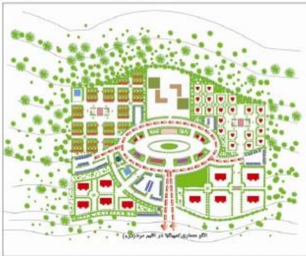
الگوی معماری در کمپینگ‌ها در اقلیم سرد (دره)

استقرار کاربری‌ها در امتداد جبهه جنوبی و بصورت خطی می‌باشد. در الگوی خطی نمی‌توان نقاط مرکزی متعدد ایجاد نمود. کمپینگ‌های واقع در دره با توجه به ضرورت‌های اقلیمی و حفاظت از خدمات اصلی از الگوی توسعه متمرکز تبعیت می‌کند. کاربری‌های اقامتی و تفریحی به عنوان دیواری محافظ برای خدمات اصلی مانند ساختمان‌های مدیریتی و پذیرایی می‌باشد. همچنین در این الگو توسعه فضایی در امتداد دره امکانپذیر خواهد بود. کمپینگ‌های واقع در دشت با توجه به اینکه امکان ایجاد دسترسی‌های شمالی جنوبی وجود دارد، امکان تلفیق در الگوی شطرنجی ستاره‌ای در الگوی استفاده از اراضی وجود داشته و الگوی ستاره‌ای موجب ایجاد مراکز فرعی در هر یک از موقعیت‌های استقرار فضایی کاربری‌ها می‌گردد و الگوی شطرنجی ساختار شبکه دسترسی را تعیین می‌کند استفاده تلفیقی از این الگو موجب حفظ کاربری‌ها از باد سوزان و عبور آن از درون شبکه دسترسی‌ها می‌گردد و همچنین تابش آفتاب تاثیر فرسایشی اندکی بر کاربری‌ها خواهد داشت.