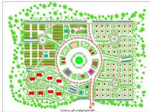
الگوی معماری در کمپینگ‌ها در اقلیم سرد (دشت)

بخش خدمات عمومی و مشترک کمپینگ نیز شامل مراکز پذیرایی، سالن همایش و لابی، سینمای روباز، فضاهای ورزشی سرپوشیده، مرکز فروش محصولات ورزشی، فضای بازی کودکان و... می‌باشد.