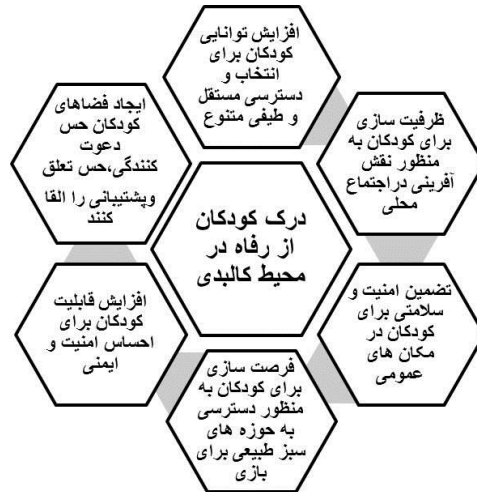
نمودار ۲. گزاره های منبعث از درک کودکان از رفاه در محیط کالبدی