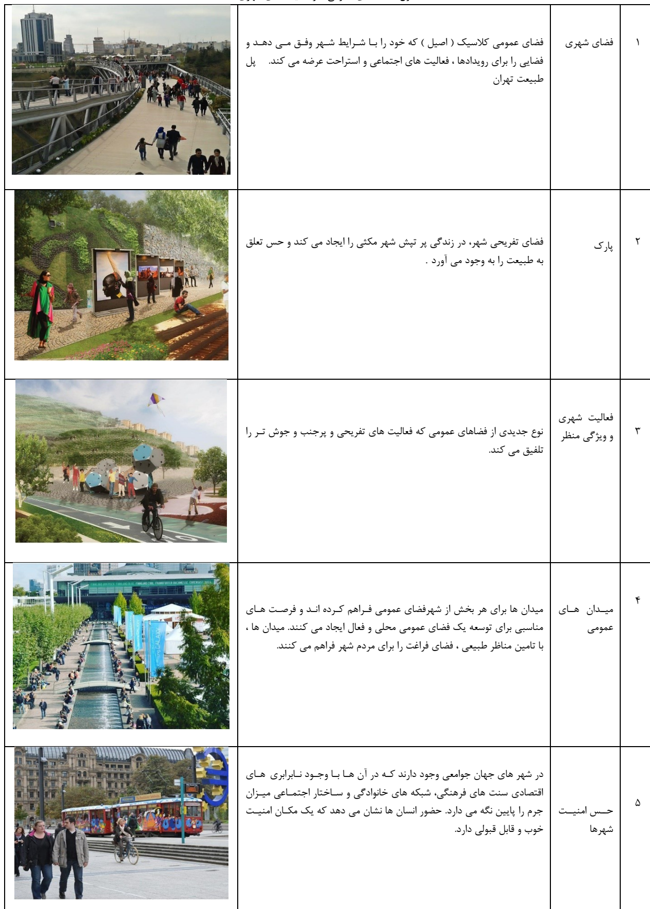
جدول ۵. فضاهای عمومی در محیط های شهری

(ماخذ: نگارندگان) ، به نقل از : ( گل ، ۱۳۸۹ ، ۲۱؛ گل، ۱۳۹۴ ، ۹۷)