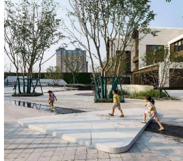
تصاویر: تسهیلات جدید جذاب برای بازی و یا شهرهای امروز

شهرهای خوب دارای فرصت‌هایی برای بازی و بیان خود هستند. راه حل‌هایی ساده عموماً متقاعد کننده‌تر هستند.