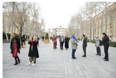
تصاویر: فعالیت‌های اجتماعی در فضاهای شهری (مکان‌سازی برای مردم به عنوان یک محل ملاقات)، تصویر سمت راست: بازدید اساتید دانشگاه‌های مختلف جهان از مجموعه تاریخی میدان مشق تهران و تصویر سمت چپ: فضای شهری، هلند