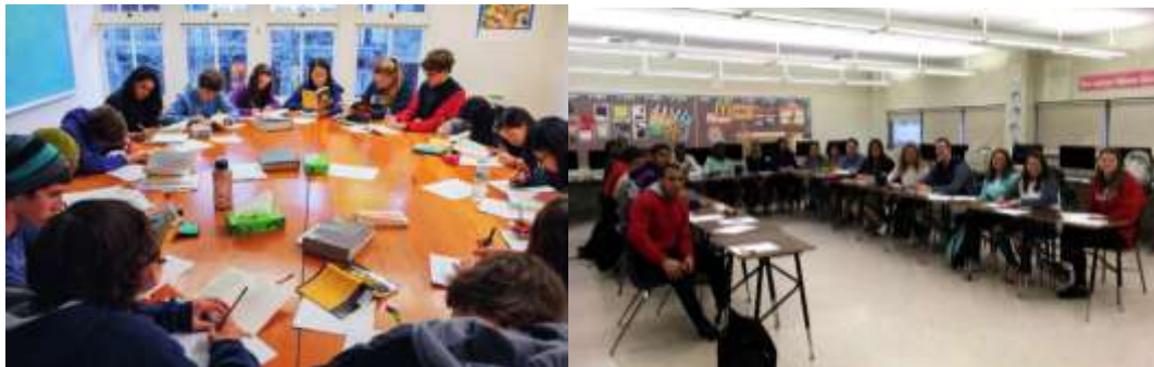
تصویر ۴ کلاسی با چیدمان مناسب برای بحث کلاسی تصویر سمت راست Easton Area Middle School

«ارائه کلاسی» از بهترین روش‌های آموزشی برای یادگیری مشارکتی است. اگر کلاس بتواند فضای مناسبی برای آماده‌سازی تکلیف گروهی باشد و امکان ارائه مناسب را به دانش‌آموزان بدهد؛ این شیوه می‌تواند به آموزش تعامل با افراد و مسئولیت‌پذیری در گروه کمک کند. چیدمان کلاسی باید روبرو به صفحه نمایش باشد و اعضای گروه ارائه‌دهنده بتوانند روبروی کلاس بنشینند و در کنار هم موضوع را برای هم‌کلاسی‌ها ارائه دهند. مناسب بودن سیستم سمعی-بصری و آکوستیک کلاس می‌تواند به اجرای بهتر این شیوه کمک کند.