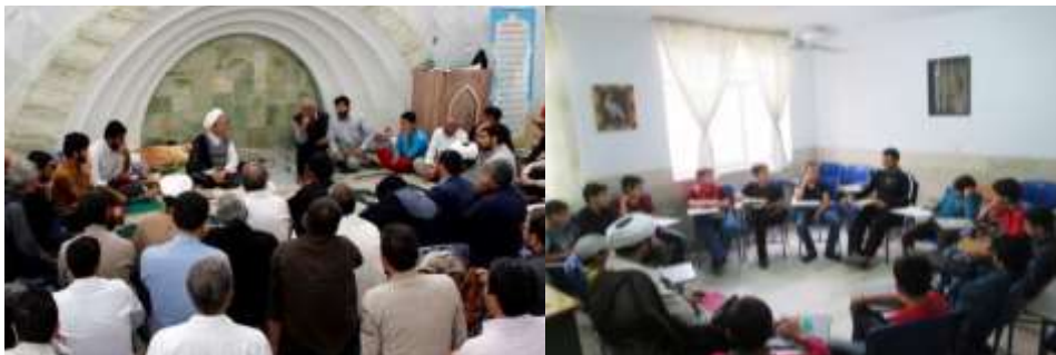
تصویر ۲ چیدمان فضای داخلی در روش حلقه