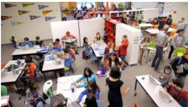
تصویر ۱۲ کلاس درس ترکیبی به روش منعطف (Summit Public Schools)

در آموزش ترکیبی به شیوه «منعطف»، اولویت با خودآموزی است و دانش‌آموزان در محیط یکپارچه مطالعه با برنامه پیشنهادی نرم‌افزاری به مطالعه درس‌ها می‌پردازد. در این شیوه، کلاس‌هایی در مجاورت فضای جمعی در نظر گرفته می‌شوند که به جنبه‌های دیگر آموزشی مانند بحث کلاسی، ارائه کلاسی، کار گروهی، کارهای هنری و کارگاهی، فعالیت‌های آزمایشگاهی و ... پرداخته می‌شود.