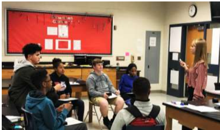
تصویر ۷- کلاسی با چیدمان مناسب برای شیوه بارش مغزی و جیگ‌ساو (Easton Area Middle School)

در روش «جیگ‌ساو» دانش‌آموزان در یک گروه کوچک به هم درس می‌دهند و بدین صورت بر مهارت‌های ارتباطی آنها و بالا رفتن میزان یادگیریشان اثر مثبتی دارد. روش «بارش مغزی» نیز در گروه‌های کوچک بهتر قابل اجراست و هر دانش‌آموز می‌تواند آزادانه نظرات خود را بیان کند. این روش از بهترین روش‌ها برای رشد خلاقیت در دانش‌آموزان است. کلاس‌های کوچک با چیدمان منعطف و قابل تغییر بهترین گزینه برای اجرای این دو شیوه هستند هرچند با تقسیم یک کلاس بزرگ در غالب چند گروه هم می‌توان این روش‌ها را اجرا کرد. داشتن یک تخته متحرک برای هر گروه می‌تواند به اجرای بهتر این روش‌ها کمک کند.