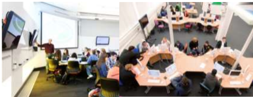
تصویر ۸ میز کار و امکانات سخت‌افزاری مناسب برای کلاس درس ترکیبی

وجود تجهیزات سخت‌افزاری مناسب همچون دستگاه‌های کامپیوتر، لپ‌تاپ و تبلت، امکانات شارژ مناسب و میزها و صندلی‌های ارگونومیک برای اجرای موفق آموزش ترکیبی الزامی است. طراحی مناسب میز کار و قفسه‌های نگهدارنده لوازم الکترونیکی و ایستگاه‌های شارژ می‌تواند نظم کلاسی در آموزش ترکیبی را تضمین کند.