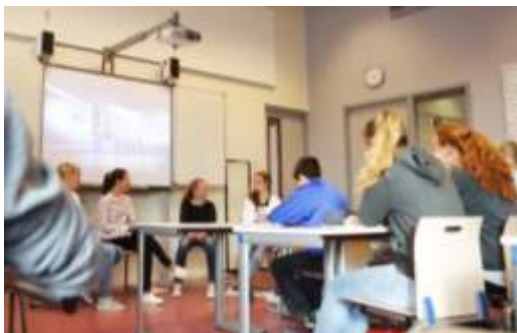
تصویر ۶ کلاسی با چیدمان مناسب ارائه کلاسی (ISW Hoogeland) (منبع: New School designs, 2012)

تصویر سمت چپ The Harkness Table, College Preparatory School, Oakland, California (منبع: New School designs, 2012)