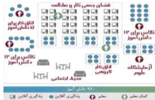
تصویر ۱۱ چیدمان مناسب کلاس درس ترکیبی به روش منعطف (New Teacher Center, 2017)