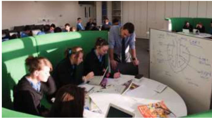
تصویر ۱۰ کلاس درس ترکیبی به روش چرخش بین ایستگاه‌ها (Chantry High School, Ipswich)

در آموزش ترکیبی به شیوه «منعطف»، اولویت با خودآموزی است و دانش‌آموزان در محیط یکپارچه مطالعه با برنامه پیشنهادی نرم‌افزاری به مطالعه درس‌ها می‌پردازد. در این شیوه، کلاس‌هایی در مجاورت فضای جمعی در نظر گرفته می‌شوند که به جنبه‌های دیگر آموزشی مانند بحث کلاسی، ارائه کلاسی، کار گروهی، کارهای هنری و کارگاهی، فعالیت‌های آزمایشگاهی و ... پرداخته می‌شود.