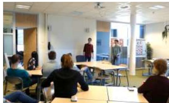
تصویر ۵ کلاسی با چیدمان مناسب برای آموزش مشارکتی (ISW Hoogeland)