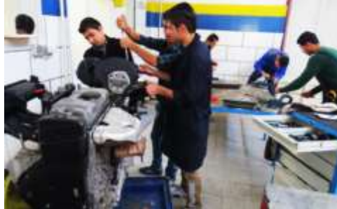
تصویر ۱ چیدمان فضای داخلی در روش استاد-شاگردی

حلقه انس، معرفت، مطالعه، شعر، پژوهش، فیلم و تدبیر در قرآن (میرمحمدیان، ۱۳۹۵). حلقه انس یک حلقه خودمانی است که افراد در فضایی صمیمی با یکدیگر درباره موضوعات مختلف صحبت می‌کنند. هدف از آن ایجاد فضای صمیمی به منظور مشخص شدن برخی ایرادهای رفتاری دانش‌آموزان است. کسب مهارت‌هایی چون ابراز نظر و تحمل مخالف از دیگر اهداف حلقه انس به شمار می‌رود (میرمحمدیان، ۱۳۹۵). حلقه مطالعه با دو هدف طراحی می‌شود یکی بالا بردن مهارت مطالعه و دیگری بالا بردن دانش کسانی که در حلقه شرکت می‌کنند. در حلقه پژوهش مهارت‌هایی همچون جمع‌آوری منابع، تعریف منابع، انتخاب موضوع، چرک‌نویس، پاک‌نویس و نحوه ارائه آموزش داده می‌شود؛ هدف باطنی حلقه پژوهش، یادگیری برخی موضوعات به بهانه پژوهش است. در حلقه فیلم بیان جنبه‌های محتوایی مثبت و منفی و درس‌های عبرت‌آموز فیلم‌ها انجام می‌گیرد (میرمحمدیان، ۱۳۹۵).