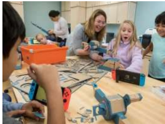
تصویر ۳ کلاسی با چیدمان مناسب برای شیوه حل مسئله

در روش‌های غیرمستقیم اولویت بر این است که دانش‌آموز خود بتواند دانش خود را با همکاری همکلاسان و مشورت معلمان شکل دهد. این روش‌ها دانش‌آموز را مسئول یادگیری خود قرار می‌دهند و چه برای دروس عملی-کارگاهی و چه دروس علمی-نظری قابل استفاده هستند. چیدمان مناسب کلاسی برای روش «حل مسئله»، کلاسی منعطف با دسترسی به انواع منابع آموزشی چاپی و آنلاین برای جستجوی دانش‌آموزان است. در این شیوه مسئله‌ای برای یک دانش‌آموز و یا یک گروه مطرح می‌شود و او سعی می‌کند با جستجو و امتحان کردن روش‌های مختلف به نتیجه برسد و معلم نقش راهنمای مسیر را بازی می‌کند. به ثمر نشستن این دو شیوه می‌تواند زمان‌بر و نیازمند حوصله زیادی باشد و لازم است چیدمان کلاسی منعطف و راحت باشد. با توجه به اینکه بعضی از دانش‌آموزان در سکوت و بعضی در هنگام صحبت در جمع، به راه‌حل می‌رسند، مناسب است کلاس‌های بزرگ، به دو بخش کار انفرادی و کار گروهی تقسیم شوند و حائلی همچون دیوار شیشه‌ای بینشان قرار گیرد.