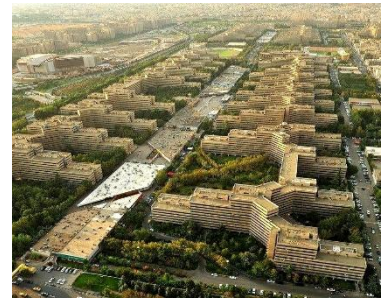
عکس (۱) - شهرک اکباتان تهران