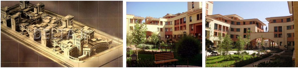
عکس (۲) - مجتمع مسکونی زیتون اصفهان