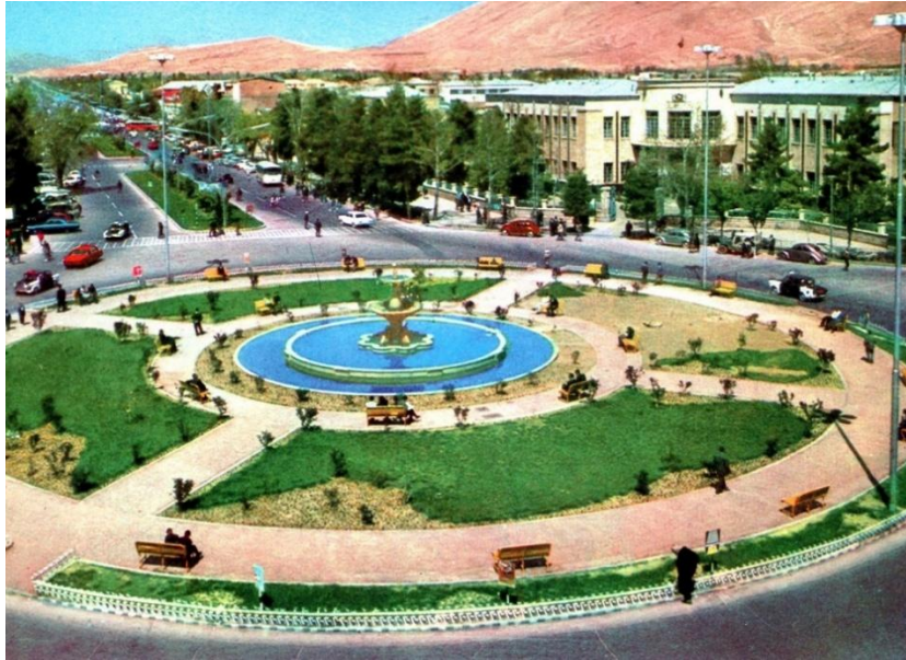
شکل ۴- میدان شهرداری شیراز

میدان شهرداری یا شهدا یکی از میدان های جدید شیراز محسوب می گردد که در ساخت و سازهای دوران پهلوی ساخته شده و به واسطه ساختمان شهرداری مرکزی یا بلدیة قدیم به این نام معروف شده است. در زمان قدیم و در دوران زندیه، تاسیسات زندی در این قسمت قرار داشته که در دوران قاجار و پهلوی به مرور تخریب و به این شکل درآمده است. با تاسیس شهرداری یا بلدیة قدیم، نام این میدان کم کم به میدان شهرداری تبدیل شد.