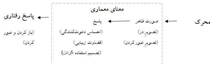
شکل شماره ۲: نظریه واسطه ای شناخت رابرت هرشبرگر (۱۹۷۴)

پیروان مکتب کنش متقابل بر این باورند که با وقوع ادراک، معنا نیز درک می شود و برای دادن معنایی جدید، تجربه ی گذشته در ادراک مداخله می کند. تحلیل درون -نگر می گوید که معانی قبلاً به وجود آمده اند. روانکاوان ویژگی ناخودآگاه ذهن را در نظر می گیرند، که خاطراتی در آن ثبت و توسط روان بیدار نگه داشته می شوند. (لنگ: ۱۳۸۶، ۱۰۹). در این میان برای درک و اهمیت معماری محیط به نظریه واسطه ای شناخت رابرت هرشبرگر را می توان ارائه داد. هرشبرگر پنج سطح معنا را تشخیص داده است. اول معنای ظاهری است. که شامل ادراک شکل و فرم می باشد؛ دوم معنای رجوع کننده؛ سوم معنای عاطفی؛ چهارم معنای ارزشیابانه و این که آیا چیزی خوب است یا نه؛ و سطح پنجم معنای تجویزی است. تفاوت قابلیت محیط با مفهوم معنای تجویزی این است که اولی به امکانات رفتاری ساختار محیط بازمی گردد و دومی با اتکا به ساختار محیط به درجه ای از اجبار در رفتار دلالت می کند.