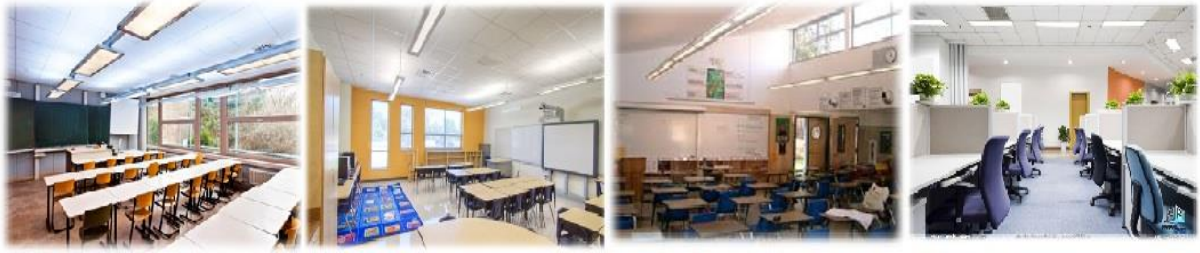
شکل شماره ۳: نورپردازی در معماری داخلی

معلمان، جلوگیری از یکنواختی محیط با تغییرات مناسب نور، تأثیرات فیزیکی که باعث بالابردن کارایی و فعالیت بدنی آنها می شود، ایجاد سرزندگی و شادابی و تأثیر مثبت بر جنبه بهداشتی (جسمی و روانی) دانش آموزان می شود (بابائی فر و نیک پور، ۱۳۹۴).