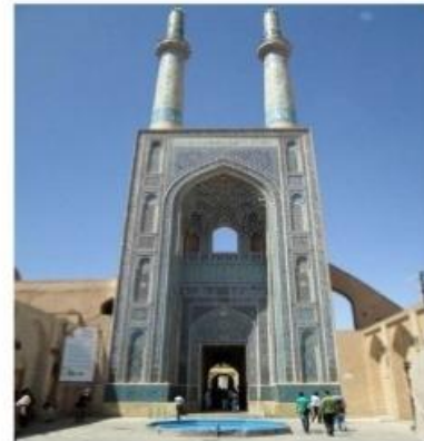
شکل شماره ۲: تزئینات و الحاقات مخالف با دستورات اسلام در مسجد شیخ زاهد و سردر ورودی مسجد جامع یزد (عصر ایران، ۱۳۹۹)