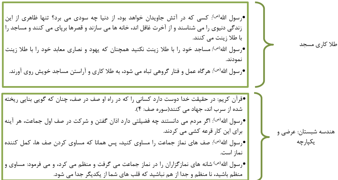
شکل شماره ۳: احادیث و روایات پیامبر (ص) و ائمه (ع) پیرامون معماری مسجد (اکبرزاده، ۱۳۹۳: ۱۴۳-۱۴۲)

"در بناهای مذهبی درون شهرها، مسجد جایگاه ویژه‌ای را به خود اختصاص می‌دهد. مسجد به‌مثابه برجسته‌ترین عنصر معمارانه منبعث از دین اسلام از اولین ازمینه حضور مدنی این دین، با جامعه همراه بوده است. مسجد کانون عبادتی، اجتماعی، فرهنگی فرهنگ دیرپای است که هرگز نمی‌تواند از ساختار اجتماعی و شهری آن جدا شود. از این‌رو، مسجد را می‌توان به‌عنوان محوری‌ترین، کانونی‌ترین و ارزشمندترین عنصر کالبد متبلورکننده‌ی مدنیت جامعه اسلامی دانست" (بهرامی و همکاران، ۱۳۹۳: ۴). به‌نظر می‌رسد عنایت به احادیث و روایاتی که از پیامبر و ائمه معصوم به‌جا مانده، درطول تاریخ اسلام از مغفولات زندگی مسلمانان بوده است. چراکه، همان‌طور که در این مقاله گوشه کوچکی از گذشته معماری و ساخت مسجد را بررسی کردیم متوجه شدیم آنچه که به‌عنوان سنت پیامبر در امر مسجد سازی شاهد آن هستیم با آنی که پیامبر خود با دستان خویش برپا داشت تفاوت‌های بنیادینی دارد. به‌هرحال به‌نظر نگارنده جامعه‌ی معماری معاصر ما می‌باید آموزه‌های اصیل اسلامی را در برپا داشتن این مکان مقدس به‌کار گیرد و به نگاهی انتقادی به آنچه که امروزه به‌عنوان اساس معماری این مکان خوانده می‌شود اهتمام ورزد. برای دستیابی به این مهم می‌بایست با درهم‌آمیزی کارکردهای محتوایی و عملکردهای کالبدی، طرحی را به اجرا بگذارد که از یک طرف با دستورات دینی مغایر نباشد و از طرف دیگر با حفظ قابلیت انعطاف، از جمود و ایستادگی در یک کالبد متعین جلوگیری کند (ن.ک شکل شماره ۴).