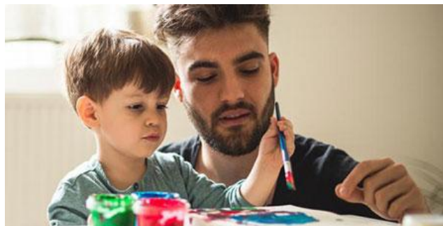
تصویر شماره ۴: کودکان والدین و نقاشی

کودک برای رشد ، قبل از هر چیز به ارضاء عاطفی و احس پیوند با محیط فیزیکی و اجتماعی خود نیازمند است . بنابراین مشخصه محیط مناسب ، وجود محرکها و انگیزه های لازم و منطبق با هر مرحله رشد کودک است . هنگام طراحی مفیدترین ترفند به منظور ایجاد پیوند عاطفی بین کودک و محیط و جلوگیری از روحیه ناخرسند در او ، در نظر گرفتن وابستگی ها و تمایلات جسمی و عاطفی کودکان در هر مرحله از رشد است . مساله مهم دیگر که در حفظ پیوند کودک با محیط و ایجاد حس امنیت روانی برای او مؤثر است ، وضوح و خوانایی محیط برای کودک می باشد . محیطی که آن را به سهولت درک و تعبیر نماید ، بنابراین یکی دیگر از ویژگیهای محیط مناسب ، انطباق داشتن با توانایی شناختی و ادراکی کودکان است در عین حال که به گسترش طرحهای ذهنی و شناخت آنان یاری رسانده بروز خلاقیت را ممکن می سازد . (بهزادپور ، ۱۳۹۸) .