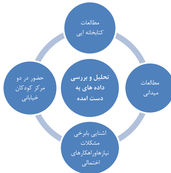
نمودار شماره ۱: روند شکل گیری طراحی

بدیهی است برای دستیابی به معیارها و مبانی طرحی که بتواند محیط مناسبی برای زندگی کودکان بی سرپرست فراهم آورده و راه حلی برای معضلات و مرکزی برای احقاق حقوقشان نیز باشد، شناخت کامل و کافی این کودکان، علل بی سرپرستی و ویژگی های روانی و رفتاری شان ضروریست. از سوی دیگر آنها فراتر از همه چیز کودکانی با نیازهای طبیعی سنشان می باشند پس لازم است با توجه به شرایط سنی و خصوصیات عام آنها کودک و ویژگیهای کودکی را بشناسیم. همچنین آشنائی با حقوق و قوانین مربوطه نیز ضروری است. این بخش با تحقیقات کتابخانه ای و بخشی نیز مصاحبه های میدانی با سرپرستان و مربیان این کودکان انجام خواهد شد. در سراسر دنیا می توان نمونه هایی از مراکز نگهداری کودکان بی سرپرست یافت. که شناخت و بررسی آنها می تواند پروژه را از تکرار خطاهای به اثبات رسیده مصون داشته و نقاط تأکید را روشن نماید. برای این بخش نیز علاوه بر منابع کتابخانه ای، مطالعات آماری بر مبنای آمارهای موجود در سازمان بهزیستی و سایر مراجع و مصاحبه با مسئولین و متخصصین امور نگهداری کودکان بی سرپرست و اطلاع از نظرات آنها در تشخیص روحیات و ویژگیهای این کودکان انجام شده است.