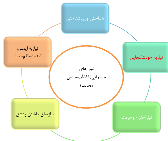
نمودار شماره ۴: سلسله مراتب نیازهای انسانی مازلو (پاکزاد، ۱۳۹۱)

مازلو معتقد است که انسان‌ها نیازهای مختلفی دارند این نیازها نه به صورت بی ارتباط و جدای از هم، بلکه به صورت سلسله‌مراتبی از نیازها در طول زندگی فرد بروز می‌آیند (پاکزاد، ۱۳۹۱).