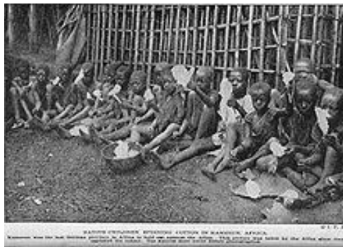
تصویر شماره ۲: وضعیت کودکان کار (و معماری زاده، ۱۳۹۵)

کودکان خیابانی به عنوان بخشی از سرمایه انسانی هستند که سلامت جسم و روان آنها می تواند نقش مهمی در سلامت جامعه داشته باشد. طبق نظر یونیسف، کودکان خیابانی با واقعیت تلخ جدایی از خانواده و خطر از دست دادن امکانات اساسی همچون آموزش و بهداشت مواجه اند. دونالد استوارت اعتقاد دارد که فقدان یا از دست دادن روابط بسنده با یکی از والدین از نظر بهداشت روانی یکی از بزرگترین مشکلات کودکان خیابانی است. این کودکان با مشکلات بهداشتی، بیماری، حفظ سلامت روانی، مشکلات روانشناختی و عدم پیشرفت تحصیلی مواجه اند (صلاحی، ۱۳۷۹). در ایران ساماندهی این کودکان بر عهده سازمان بهزیستی میباشد. طبق آمار سازمان مذکور، تعداد کودکان کار در سال ۱۳۸۴، ۷۸۴ نفر بوده است. تفاوت فاحش میان آمار کودکان کار که تحت پوشش بهزیستی قرار می گیرند با آمار تخمین زده شده توسط کارشناسان، نشانگر مخفی بودن تعداد قابل توجهی از این کودکان است. بر اساس یک سرشماری انجام شده در کشور ایران، حدود ۱۲٪ از جمعیت ده تا نوزده سال کشور ما فعالیت اقتصادی دارند