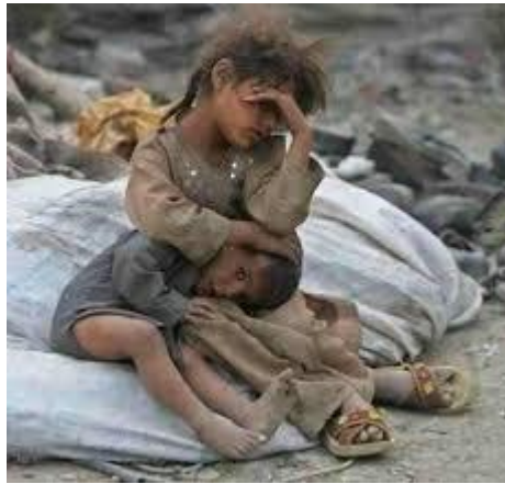
تصویر شماره ۳: وضعیت کودکان کار (معماری زاده، ۱۳۹۵)