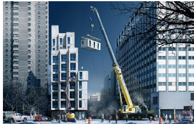
تصویر ۵: ساخت واحدهای برج کارمل پلیس در کارگاه