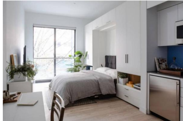
تصویر ۷: فضای داخلی ساختمان کارمل پلیس

استفاده بهینه از فضا، در نظر گرفتن سقف بلند، بکارگیری مبلمان چندمنظوره و انعطاف پذیر، وجود نور طبیعی به واسطه وجود پنجره بزرگ، فضای داخلی دلچسب و کارآمدی را برای واحدهای آپارتمان به ارمغان آورده است.