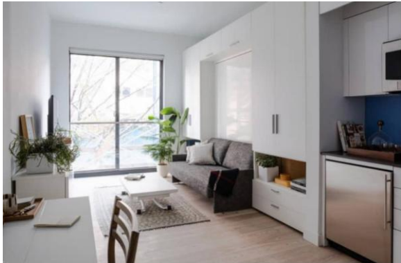
تصویر ۸: فضای داخلی ساختمان کارمل پلیس

اهداف طراحی تیم طراح برای فضای داخلی واحدها، دستیابی به حس جادار بودن و راحتی و کارایی بود، به طوری که حتی وقتی سطح اشغال واحدها را کوچک می‌کنیم تیم معمار برای رسیدن به اهداف ذکر شده اندازه همه چیز به جز مساحت کف را افزایش می‌دهند (Mears&Ruth, 2019, 22).