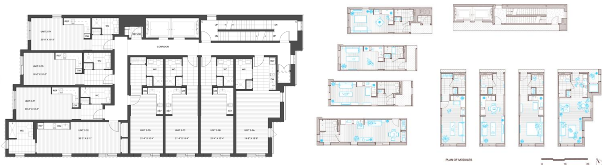
تصویر ۶: پلان تپ طبقات ساختمان کارمل پلیس

معماران پروژه هفت نوع واحد مختلف را برای سلیقه‌ها و نیازهای متفاوت کاربران طراحی کردند.