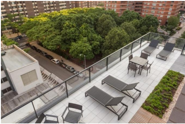
تصویر ۱۱: فضای بام مجتمع کارمل پلیس