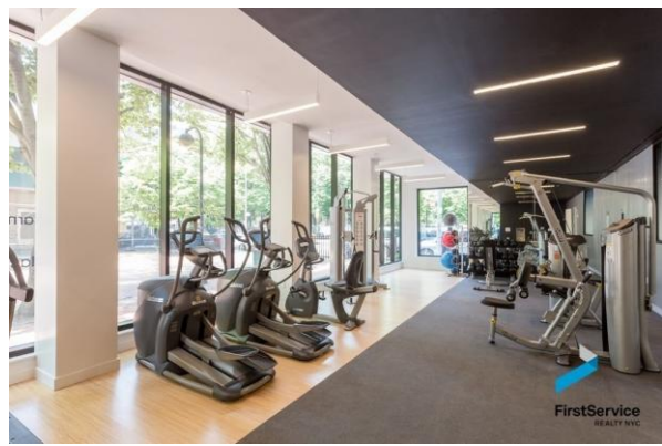
تصویر ۱۱: سالن ورزشی مجتمع کارمل پلیس

فضاها به گونه‌ای طراحی شده‌اند که عملکردهای متنوعی را ارائه می‌دهند و به صورت مرکزی قرار دارند. این امر ارتباط موثر بین ساکنین آپارتمان با جامعه اطراف را تقویت می‌کند. فضاهای معمولی یک خانه در کل ساختمان پراکنده شده است و بدین ترتیب ساکنان را در طول روز ترغیب به تعامل با همسایگان می‌کند (Mears&Ruth, 2019, 22).