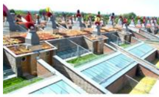
شکل شماره (۷) : مجتمع : مجموعه بدینگتون