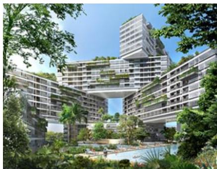
شکل شماره (۴): مجتمع مسکونی اینترپلیس