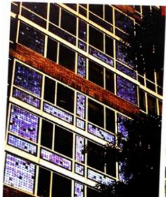
شکل شماره (۳): نمای مجتمع مسکونی سولر