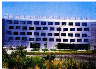
شکل شماره (۸) : ساختمان نیبر نورث .