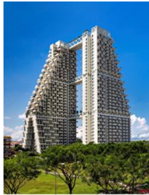
شکل شماره (۵) : برج های دو قلو (www.google.com)