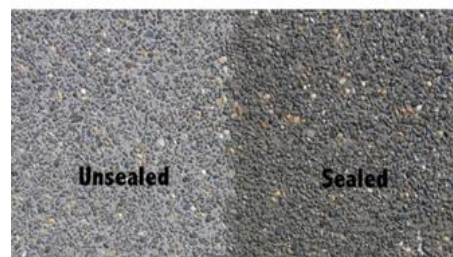
شکل ۲- پوشش نفوذگر کریستال شونده Aquafin IC