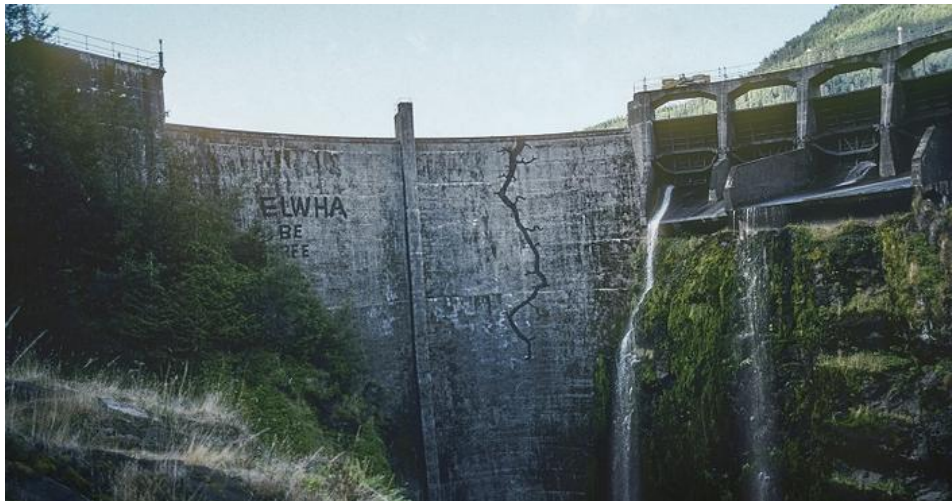
شکل ۱- آسیب دیدگی سازه‌های هیدرولیکی

هر سازه بتنی در طول مراحل ساخت و بهره‌برداری می‌تواند به علل مختلف مانند خوردگی آرماتورها، نفوذ آب، حمله سولفات و کلرها، کربناسیون، قلیایی شدن بتن، اشتباهات طراحی و بارگذاری، حوادث، ترک‌های ناشی از جمع‌شدگی و عدم کیورینگ و نگهداری مناسب، عدم اجرای نامناسب بتن، عدم کیفیت لازم طرح اختلاط، عدم فراهم بودن شرایط مناسب بتن‌ریزی و ... دچار نقص کیفی در بتن گردد که باعث تحلیل عضو بتنی، کاهش شدید دوام و مقاومت بتن و حتی از بین رفتن دائمی عضو می‌گردد. از سوی دیگر بدیهی است که هرگونه ترمیم و تعمیر اصولی و کارآمد بتن نیازمند تشخیص کارشناسی عوامل ایجادکننده نقص و تشریح نیازهای مورد نظر از ترمیم می‌باشد که این امر، خود نیازمند احاطه کامل کارشناسان به مصالح متنوع ترمیمی - چه از نظر ساختار و چه از منظر کاربرد و اجرا - است. چرا که عدم رعایت اصول و مراحل ترمیم بتن می‌تواند باعث تشدید آسیب‌ها، تحمیل هزینه‌های مضاعف و کاهش بیش‌ازپیش کیفیت عضو و کاربری آن می‌شود. از این رو بدیهی است که یک عملیات ترمیم اصولی و با کیفیت، در تعامل با مجموعه‌ای از دانش‌های فنی و تجربه اجرایی مورد نیاز انجام‌پذیر است. در همین راستا روزبه‌روز مصالح نوینی معرفی می‌شود که کاربردهای فراوانی داشته و مشکلات مصالح قدیمی را ندارند. از جمله خصوصیات مصالح نوین باربری زیاد، سبکی، زیبایی، نصب و حمل آسان و طول عمر فراوان می‌باشد (مصباح ایران‌دوست و فرخی زاده، ۱۳۹۳).