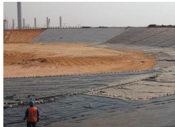
شکل ۴- مصالح پلیمری ژئوتکستایل در سدهای خاکی