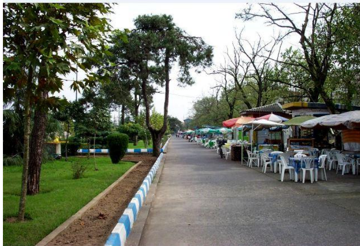
شکل ۲- کافه های حاشیه بلوار بندرانزلی

مشاهده مستقیم: استقبال شهروندان از بلوار بندرانزلی بسیار زیاد است، به خصوص در روزهای آخر هفته، حضور آن ها به اوج خود می رسد. به دلیل تنوع فضای سبز و وجود دریا و دید و منظر به فعالیت های بندری، این بلوار در اکثر ساعات روز و در روزهای مختلف سال مملو از جمعیت است. فعالیت ها در این بلوار معمولاً به چند صورت انجام می شود: نشستن و ایستادن مقابل دریا، نشستن و ایستادن به منظور صحبت و استراحت، حضور در کافه های حاشیه بلوار.