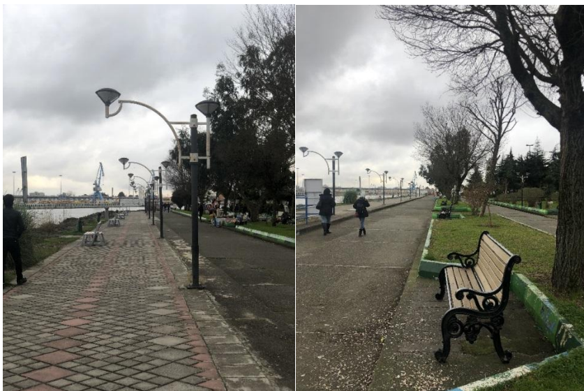
شکل ۳- کیفیت و چیدمان مبلمان فضایی بلوار بندرانزلی

مشاهده غیر مستقیم: جهت ارزیابی چیدمان مبلمان فضای شهری محدوده ی مورد نظر با توجه به مولفه های سرزندگی، پرسشنامه ای تهیه و در میان شهروندان توزیع گردید. میزان تاثیرگذاری مبلمان شهری و مولفه های سرزندگی در قالب سولاتی آنالیز شده مورد پرسش قرار گرفت. بنابراین از بین ۱۰۴ نفر به عنوان جامعه نمونه انتخاب گردید.