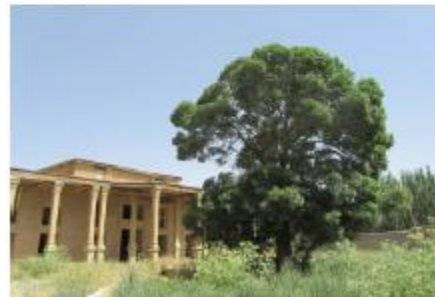
تصویر شماره (۲) قلعه صمصام السلطنه شلمزار

طبقه اول دارای چندین اتاق با طاق و تویزه و با خشت خام پوشش شده. بسیار محکم و استوار باقی مانده است. جلو این طاق را ایوانی با ستون های سنگی در بر گرفته است. که با نقوش حجاری شده گیاهی ترئین شده است. طبقه دوم که ایوانی ستون دار مشابه طبقه همکف داشته است خراب شده و آثار زیادی متاسفانه بر جای نمانده است. تصویر شماره (۳)