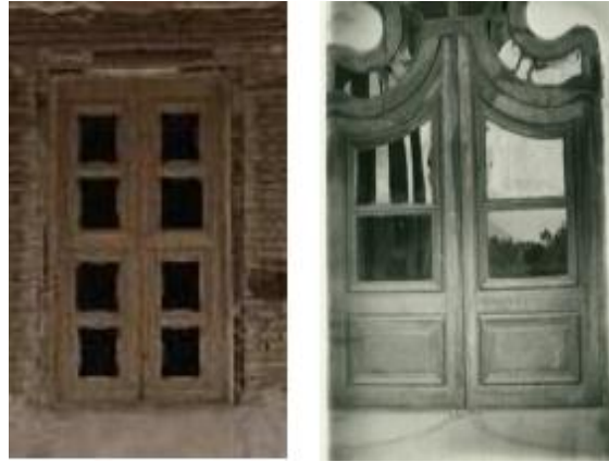
تصویر شماره (۱۱) نمونه ای به جای مانده از بازشوهای بالای درب اصلی ورود به عمارت

هنر چوب آرابی در درب های اصلی دو طبقه اعیانی، قاب بندی های زیر سقف ونرده لبه راه پله بکار رفته است. دودرب چوبی شبیه به هم در قلعه موجود است. درب اصلی طبقه همکف تقریباً سالم و درب اصلی طبقه فوقانی که از جای کنده ودر باغی در روستای ایرانچه نصب گردیده که صدمات زیادی دیده و تقریباً قابل تعمیر نیست. این درب ها دولنگه و دارای چهارچوب شیاردار هستند که دربالا به صورت نیم بیضی درآمده است. نیم بیضی پائین شبیه " آکلاد" شیاردار است، که از میان آند و نیم قوس منشعب گردیده است. به نظر آقای آخوندی منظور هنرمند چوب آرا در این قسمت درب نشان دادن دو چشم در طرفین و ابروان در بالا بوده است که شاید در ارتباط با چشم زخم و نظر زدن بوده است. هر دولنگه درب دارای یک قاب بزرگ در بالا و یک قاب بزرگ در پائین هستند(امام بخش و صفائی بروجنی، ۱۳۹۹: ۷۰-۷۱). تصاویر شماره (۱۱) و (۱۲)