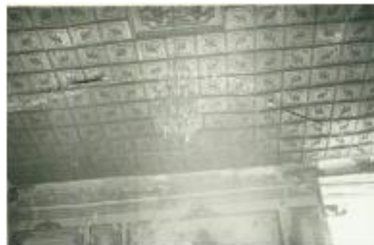
تصویر شماره (۱۲) تصویر قدیمی از توفال کوبی سقف درطبقه بالا

در قاب های بالایی با سیم های فلزی و معرق چوب، نقش گل وگلدان به صورت هنرمندانه ای تزئین گردیده است. درقاب های پائینی با استفاده از تکنیک فوق نقوش گیاهی مشاهده می گردد. نرده لبه راه پله ها به شیوه معمول و با ستون های چوبی کوچک خراطی شده به وجود آمده اند. قاب بندی های زیر سقف با ایجاد نقوش هندسی توسط بازوها و سپس قاب هایی از چوب گردو تزئین گردیده اند. این بخش از تزئینات به لایه تزئینی زیر سقف سرسرا و فضای ایوان محدود می شود دارای هندسه ای ساده متشکل از تقسیمات شطرنجی با نقوش خاصی که درتصاویر به وضوح دیده می شوند(امام بخش و صفائی بروجنی، ۱۳۹۹: ۶۹-۷۰).