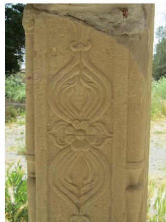
تصویر شماره (۸) طرح ستونهای حجاری شده

ستونها از نوع چهارگوش شیاردار هستند و در زوایای آنها (شبهه پاستونها) گلدان هایی حجاری شده است. که ساقه گل تا انتهای ستون ادامه دارد و در رأس آن چند برگ گل مشاهده می گردد. در هر جانب ستون یک شیار وجود دارد، سرستون ها از نوع مختلط هستند و نقوش مختلط گیاهی به صورت متعادل و زیبا در سر ستون ها حجاری گردیده است.