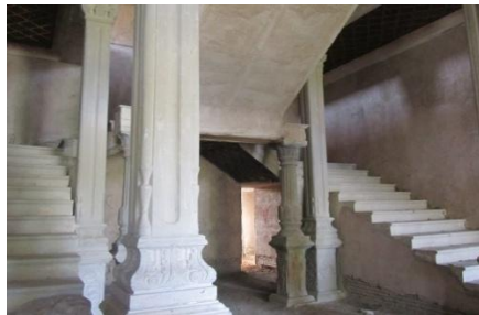
تصویر (۷) نمایی از ستون و پلکان قلعه صمصام السلطنه شلمزار

در سقف ایوان ها تنها قاب دورتادور به جای مانده و قسمت وسطی کاملاً تخریب شده است (احمدی و اصغریان، ۱۳۹۸: ۷۲). تصاویر شماره (۶-۷)