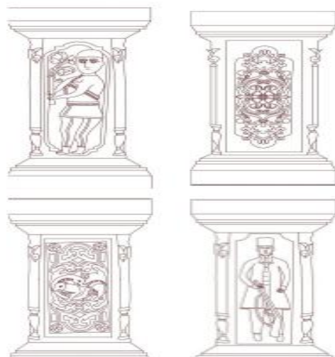
تصویر شماره (۱۰) ستونهای حجاری شده زیر راه پله (امام بخش و صفائی بروجنی، ۱۳۹۹: ۷۰).

طرف دیگر این پاستون ها نقوش گیاهی حجاری شده و در زوایا مانند پاستون های ایوان دارای نقش گل و گلدان هستند. ستون ها و سر ستون های این دو شبیه دو ستون بلند مقابل آنهاست. نقوش ستونها هرگز به صورت یکنواخت تکرار نشده اند بلکه تکرار آنها حالتی متناوب دارد. تزئینات سنگی معمولاً پردوام ترین نوع تزئینات در یک بنا هستند و به همین دلیل است که تقریباً همه تزئینات غیر سنگی تخریب شده و از بین رفته اند. تصویر شماره (۱۰)