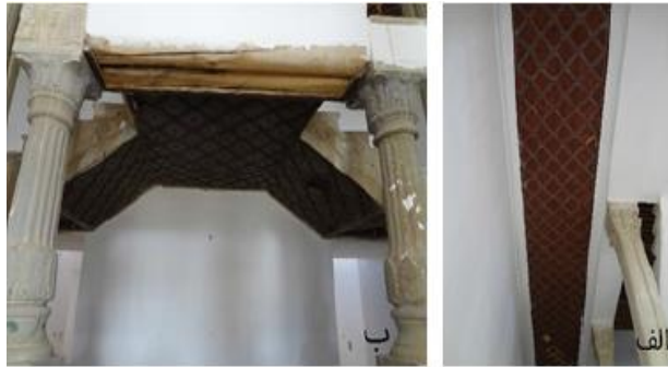
تصویر (۵) سقف پلکان (نگارنده)

سقف پلکان ما بین دو طبقه دارای گره های لوزی مربع از جنس چوب و رنگ شده، به مساحت ۳۲.۲۶ متر مربع است. و قسمت زیرین محل تلاقی پلکان، دارای گره لوزی مربع است. وسط هر یک از قاب ها، میخکوبی با نقش چلیپایی به کار برده شده است. این گره به مساحت ۸.۸ متر مربع کار شده است. در سقف ایوان ها تنها قاب دورتادور به جای مانده و قسمت وسطی کاملاً تخریب شده است (احمدی و اصغریان، ۱۳۹۸: ۷۲). تصویر شماره (۵)