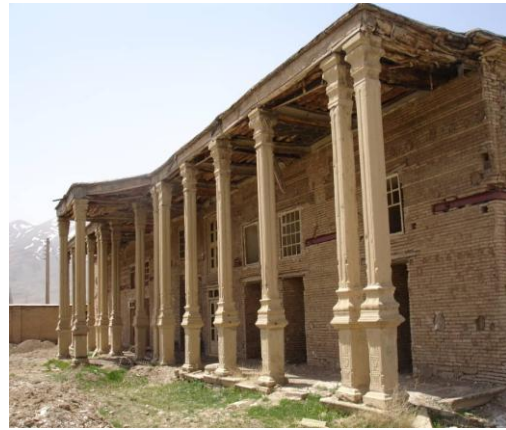
تصویر شماره (۱) نمایی از قلعه شلمزار