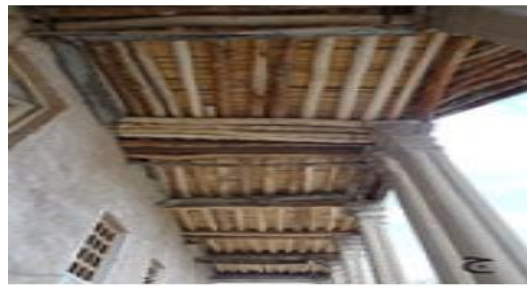
تصویر (۶) نمایی از قلعه صمصام السلطنه شلمزار

دارای چندین اتاق بصورت طاق و چشمه و با خشت خام ساخته شده است و محکم و استوار باقی مانده است. جلو این اتاق راه، ایوانی با ستون های سنگی در بر گرفته است که به شیوه زیبایی و با نقوش حجاری شده گیاهی، تزیین شده است (احمدی و اصغریان، ۱۳۹۸: ۷۲).