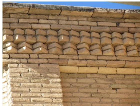
تصویر شماره (۱۳) آجر کاری دیوار های قلعه صمصام السلطنه شلمزار

تزئینات آجری در قلعه شلمزار کم به کار رفته است و بیشترین تزئینات در این مورد را می توان به نمای جبهه غربی بنا اشاره کرد. وستوری بالای در انبار در انتهای نمای جنوبی. تصویر شماره (۱۳)