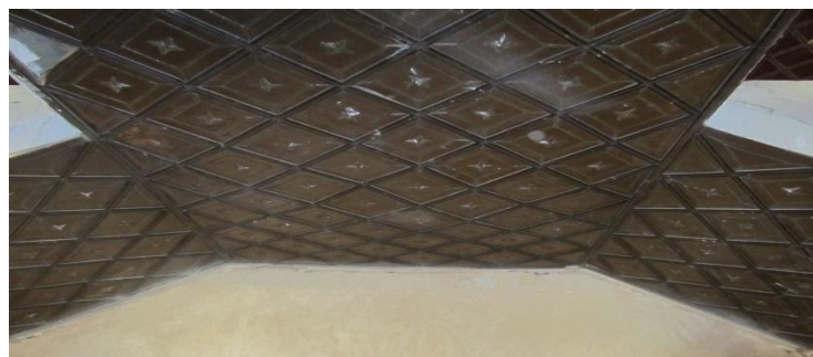
تصویر (۳) معماری قلعه صمصام السلطنه شلمزار (قربانی و ولی بیگ، ۱۳۹۴: ۱).

طبقه اول دارای چندین اتاق با طاق و تویزه و با خشت خام پوشش شده. بسیار محکم و استوار باقی مانده است. جلو این طاق را ایوانی با ستون های سنگی در بر گرفته است. که با نقوش حجاری شده گیاهی ترئین شده است. طبقه دوم که ایوانی ستون دار مشابه طبقه همکف داشته است خراب شده و آثار زیادی متاسفانه بر جای نمانده است. تصویر شماره (۳)