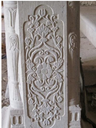
تصویر شماره (۹) طرح ستونهای حجاری شده

ایوان در کل دارای ۱۸ ستون سنگی است. لبه ایوان با تخته سنگی لبه دار پوشیده شده است، و روی آنها پا سنگ ستون قرار دارد که چهار طرف آنها فرز کاری شده است. پاستونها در چهار جانب دارای نقوش حجاری شده هستند که این نقوش به صورت قرینه روبروی هم قرار دارند و عبارتند از: نقش گل و گلدان (گلدانها پایه دار و زیر آنها نقش چهارپایه حجاری گردیده است) و دو نقش مرکب دلخواه حجار. در زوایای پاستونها نقش گلدان حجاری شده که ساقه گل به صورت ساده بالا آمده و در رأس آن چند برگ قرار دارد. خشت های زیر ستونها دارای مقاطع مربع هستند، که اضلاع به صورت برجسته فرز کاری شده است و پایه ستون ها دارای نقوش گیاهی حجاری شده هستند (امام بخش و صفائی بروجنی، ۱۳۹۹: ۶۹-۷۰). تصویر شماره (۸) و (۹)