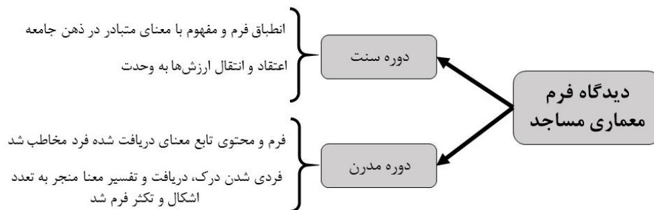
شکل ۱- مقایسه فرم مساجد در دوره سنت و مدرن (مآخذ: نگارندگان)

تاریخ در خود مکاتب و سبک‌های مختلفی را دارد که در هر دوره نمود عینی یافته است. بعد از دوران اولیه‌ی حیات بشری، روند طراحی و پیدایش فرم طبق قواعد انجام می‌شد، در این دوران «قالب‌ها و الگوهای فضایی صوری و رسمی حاکم‌اند و سیمای فضای مصنوع نسبت به دوره‌ی بعد دارای وحدت صوری بیشتری است. در این مرحله تمایزات منطقه‌ای و محدوده‌های قومی و ملی قابل‌مشاهده است.» (نوحی، ۱۳۸۸: ۲۰۴) بنابراین الگوهای حاکم به‌طور تدریجی تغییر می‌کردند و به‌ندرت در یک‌زمان واحد الگوهای متنوع رایج می‌شد و آنچه به‌عنوان سبک در جامعه حاکم می‌شد، دارای جنبه‌ی آیینی و فرمال بود. این دوره برخلاف دوران مدرن است که در آن وارد قلمرو آزادی اندیشه، با سبک‌های متنوع، می‌شویم. نتیجه‌ی این آزادی اندیشه و آزادی در طراحی در دوران مدرن، ظهور اشکال متنوع و متفاوت است. به‌گونه‌ای که حتی ابنیه‌ی مذهبی طی یک سده دارای اشکال بسیار متنوعی است. اشکالی که علاوه بر تفاوت با اشکال سنتی، با یکدیگر در زمان واحد نیز تفاوت دارند. نظیر کلیسای رونشان لوکوربوزیه (نوحی، ۱۳۸۸: ۲۰۴ تا ۲۰۶).