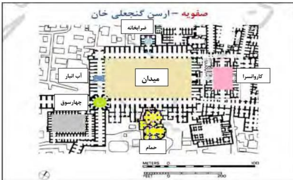
تصویر 1: میدان گنجعلی خان و بناهای اطراف آن، (منبع: شفیعی و همکاران، 1394). تحلیل: نگارنده.