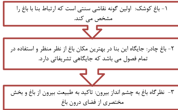
شکل (۵): تقسیم بندی طراحی باغ در نقاشی مینیاتور (نگارندگان، ۱۴۰۱)

بسیاری از نقاشی های مینیاتور که در آن به فضای باغ توجه داشته است، داستان یک اسطوره را عنوان کرده است، که فضای معماری باغ به صورت ضمنی در اثر مورد توجه قرار گرفته است. هدف اصلی نقاش در اینجا روایت داستان می باشد. طراحی باغ در مینیاتور به سه گونه کلی تقسیم می شود که در شکل شماره (۵) ارائه شده است: