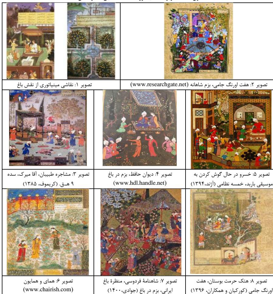
جدول (۲): تصاویر منتخب مورد مطالعه تحقیق (نگارندگان، ۱۴۰۱)

نمونه ۱؛ تصویری است که نشان می‌دهد تذهیب و تشعیر در کجا نوشته و در کجا نقش باغ ترسیم شده است. ذهنیت از باغ ایرانی در هنر مینیاتور بسیار قوی و غنی پرداخته شده است. که حتی از ایران هم فراتر رفته و در کشورهای دیگر هم دیده می‌شود. اگر پلانی هست، درخت را عمومی نشان داده است. اگر خانه ایی ترسیم شده، بیرون، درون و همه بعدهای مختلف هم زمان به نمایش در آمده است. (محمدزاده و نوری، ۱۳۹۶). در این تصویر باغ ایرانی با تمام جزئیات معماری و تزئینات، گیاهان بومی سرزمین مان از درخت و گل، پرندگانی بر شاخسارها و مرغابی‌ها و ماهی‌های شناور در آب حوض و فواره و آبنمای موجود در باغ‌ها، همگی در نقاشی‌ها دیده می‌شود. نقوش کاشی کاری، تخت گاه و سرپرده‌های رنگین با نقوش گل و بوته که در باغ‌ها و زندگی مردم وجود داشته نیز در صحنه‌های مینیاتور ترسیم شده‌اند.