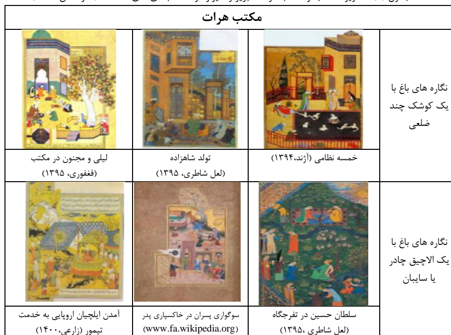
جدول (۳): تصاویر منتخب از مکاتب هرات، تبریز و شیراز در دسته بندی های سه گانه (نگارندگان، ۱۴۰۱)

تصاویر یافته از منابع مختلف در هر مکتب به تفکیک دسته بندی مذکور در جدول شماره (۳) ارائه شده است.