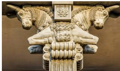
تصویر ۲: نمونه‌هایی تزئینات عین به عین و در نظر نگرفتن تناسبات