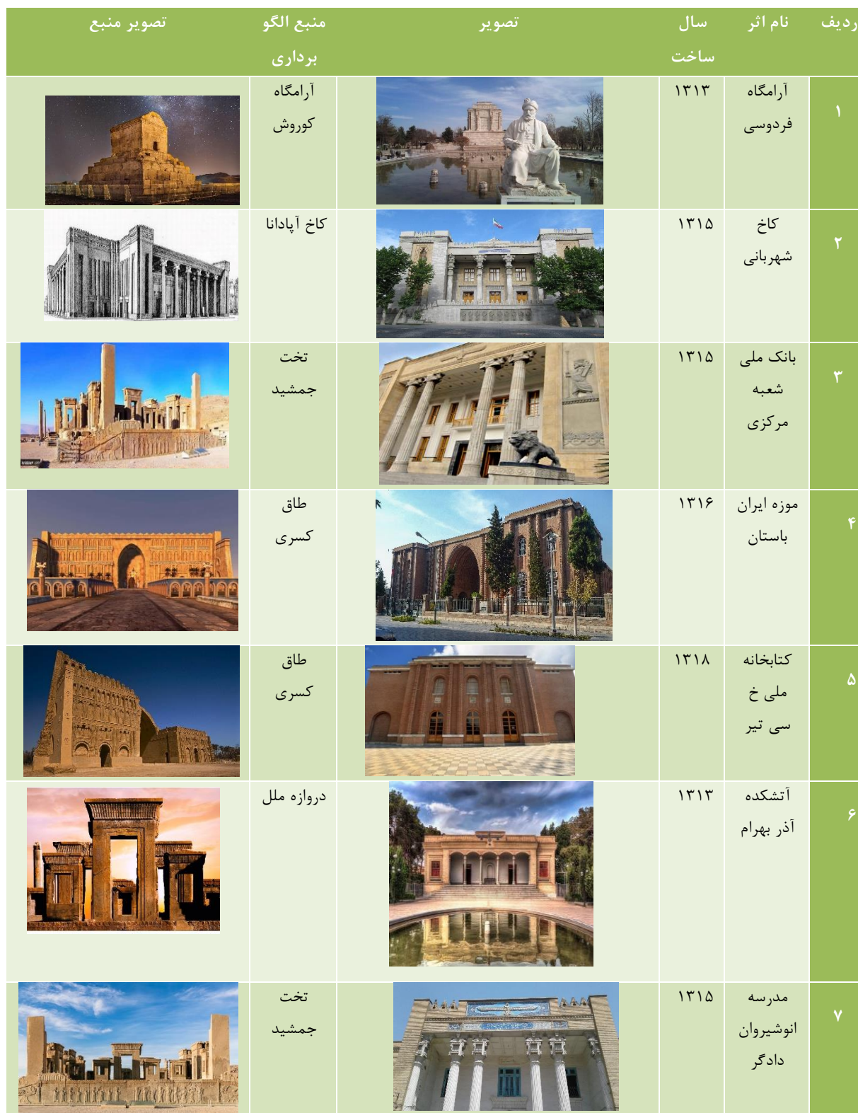
جدول ۲: اولین نمونه‌های سبک ملی‌گرایی در ایران (نگارندگان)

گذشته ایران هستیم. شکل‌گیری کنگره‌های مهم با رویکرد معرفی هنر باستانی ایران در سایر کشورها و نیز کنگره بین‌المللی هزاره حکیم فردوسی در ایران و تأسیس انجمن آثار ملی در سال ۱۳۰۴ از عواملی بود که توسعه باستان‌شناسی در کشور را موجب شد. در برخی از بناهایی که طراحی احجام آنها براساس بناهای باستانی شکل گرفت، بدون آنکه مستقیماً تقلیدی از فرم‌ها یا عناصر معماری هخامنشی، اشکانی و ساسانی داشته باشند طرحی خلاقانه را بوجود آوردند که بتوانند معرف شخصیت معماری زمان خود و هویت ملی باشند.