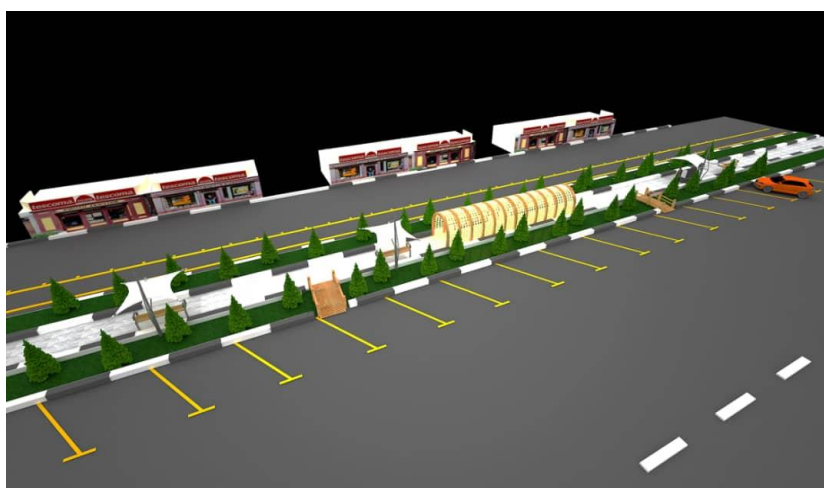
تصویر شماره ۲: طرح پیشنهادی اجرای طرح زندگی شبانه در محدوده مورد نظر