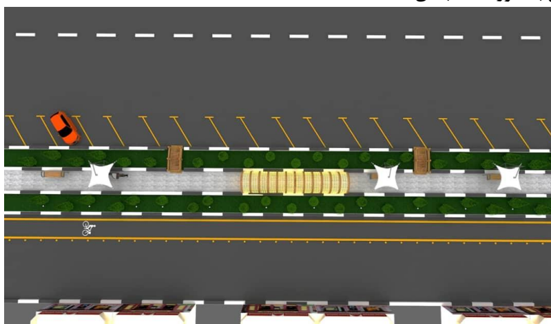
تصویر شماره ۱: طرح پیشنهادی اجرای طرح زندگی شبانه در محدوده مورد نظر