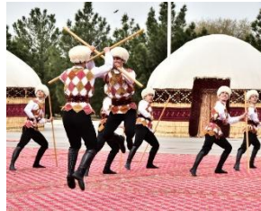
شکل ۱۲- برگزاری مراسم های نمایشی همراه با موسیقی هنگام نوروز در ترکمنستان