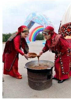
شکل ۱۳- سمنوپزان در نوروز. ترکمنستان