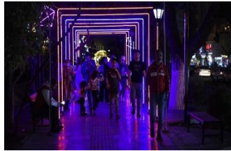
شکل ۶- تزیین شهر و برگزاری جشن نور در ایام نوروز در تهران

و نواحی و نیز بازی‌ها و نمایش‌هایی برای کودکان و خانواده‌ها همراه هستند (شکل ۸-۵). برگزاری این عید مجموعه‌ای از آیین‌ها و رسوم گوناگون را دربر می‌گیرد که حتی تا پس از تحویل سال جدید نیز ادامه پیدا می‌کند و از ترتیب ویژه‌ای برخوردار هستند (میراث فرهنگی، گردشگری و صنایع دستی ایران). بنابر توالی این رسوم می‌توان آن‌ها را به آیین‌های پیشواز یا پیش از نوروز، روز نوروز یا تحویل سال، و پس از نوروز دسته‌بندی نمود. برگزاری این مناسک نوروزی، بسته به باورها و اعتقادات بومی متفاوت در هر منطقه، آداب گوناگونی را شامل می‌گردد؛ اما شماری از این تشریفات، فارغ از هویت و فرهنگ قومی و بومی، به عنوان نمادهای برجسته این عید در میان تمامی اقوام مردم ایران و نیز پاسداران آن در سراسر دنیا، متداول هستند. خانه تکانی، سمنوپزان، یاد کردن اموات، غسل و استحمام و بر تن کردن رخت نو، چیدمان سفره نوروزی هفت‌سین، پخت غذاهای نوروزی، بازی‌ها و ورزش‌های نوروزی، دید و بازدید خویشان و دوستان و سیزده‌بدر از جمله آیین‌های شاخص جشن نوروز در ایران هستند که در ادامه به تفصیل بررسی خواهند شد.