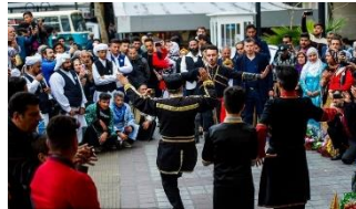
شکل ۲۲- برگزاری مراسم‌های جمعی در نوروزگاه‌های تهران

اسب‌دوانی، ورزش ملی کشور ترکمنستان است و در این ایام چابک سواران ترکمنی با سوار کاری و حرکات نمایشی بر اسب‌های ترکمنی آخال تکه در گسترده ترین مسابقات اسبدوانی به مناسبت نوروز حضور به عمل می‌آورند. این مسابقات حتی در دستور کار دولت نیز قرار دارد و هر ساله از سمت حکومت و مردم این کشور مورد استقبال فراوان قرار می‌گیرد (شکل ۲۳-۲۴).