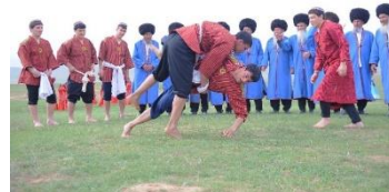
شکل ۲۳- برگزاری کشتی به هنگام نوروز در ترکمنستان