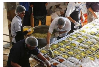
شکل ۱۹- اهدا سبزی پلوماهی عید به نیازمندان در تهران