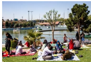
شکل ۲۵- برگزاری مراسم سیزده‌به‌در در ایران