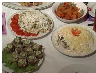
شکل ۲۰- خوراک‌های نوروزی کشور ترکمنستان

در کشور ترکمنستان، خوراک‌ها از ارکان مهم برگزاری جشن نوروز هستند (شکل ۲۰). آن‌ها هنگام نوروز خوراک‌هایی را حاضر می‌کنند که نامشان با نوروز آغاز می‌گردد. «نوروز گجه» و «نوروز یارمه» از خوراک‌های ترکمنی هستند که در ایام تعطیلی نوروز پخته می‌شوند و همین نوع توجه به نوروز در این کشور، به این عید رنگ و بویی ملی می‌بخشد. هنگام برگزاری نمایشگاه‌های نوروزی در ترکمنستان، زنان غذاهای بومی مختلف و انواع شیرینی‌ها و نان‌های سنتی را می‌پزند و از حاضرین پذیرایی به عمل می‌آورند (غلامحسین‌زاده، ۱۳۸۲، ۱۷۲).