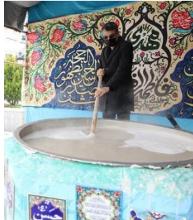
شکل ۱۴- سمنوپزان در نوروز در کشور ایران