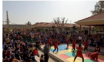
شکل ۲۱- مسابقات ورزشی نوروزی در تهران