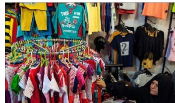
شکل ۱۵- بازار خرید نوروزی لباس در تهران