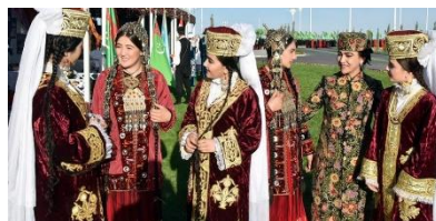
شکل ۱۶- پوشیدن لباس‌های سنتی هنگام نوروز در ترکمنستان

در ترکمنستان نیز بنا بر این رسم، پیش از نوروز، لباس نو و آجیل و شیرینی عید تهیه می‌کنند. دختران و پسران و پیران و جوانان همه با لباس‌های نو و رنگارنگ به میداين و گردشگاه‌های شهر می‌آیند و به جشن و شادی مشغول می‌گردند. پوشیدن لباس‌های ملی و محلی (شکل ۱۶) نیز در این ایام از سنت‌های ترکمن هاست و خواهان بسیاری دارد. این البسه ملی نمادی از برگزاری جشن نوروز در روزگار قدیم این سرزمین است (غلامحسین زاده، ۱۳۸۲، ۱۷۱).