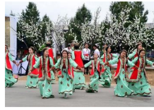
شکل ۹- رقص نوروزی کودکان در ترکمنستان