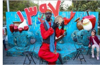
شکل ۷- نوروزگاه در بلوار کشاورز تهران