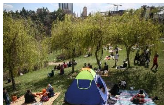
شکل ۲۶- برگزاری مراسم سیزده‌به‌در در تهران

برای برگزاری جشن نوروز، خوانندگان و نوازندگان مشهور در پارک‌هایی مانند پارک استقلال در عشق آباد، و یا سایر مراکز عمومی شهرهای ترکمنستان به میان مردم قدم می‌گذارند و کنسرت‌ها و برنامه‌های مختلفی اجرا می‌کنند. مراسم لاله‌خوانی ۱۵ یا رقص «کوشت دپدی» که جلوه‌ای دیگر از رقص مشهور خنجر است در میدان‌های اصلی شهر برگزار می‌شود (غلامحسین‌زاده، ۱۳۸۲، ۱۷۲).