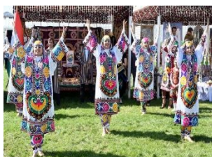
شکل ۲۷- حضور مردم ترکمنستان در طبیعت در ایام نوروز