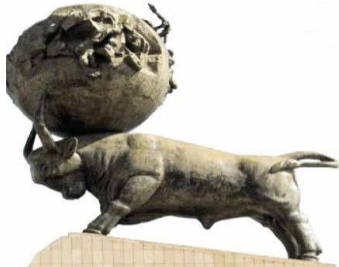
شکل ۳- بنای یادبود قربانیان زلزله ۱۹۴۸ واقع در موزه زلزله شهر عشق آباد در کشور ترکمنستان

شده بود و آنها نیز به تاثیر از فرهنگ ایرانی، بر این باورند که هنگامی که جمشید به عنوان چهارمین پادشاه پیشدادی بر تخت نشست آن روز را نوروز نامیدند (حیدری ۱۳۹۷، ۱۲۴) در زبان ترکمنی، دُموزی را «توموس» یا تومیس و اینانا را به عنوان آنه، آناه، و امه می‌شناختند که همانند زبان سومری در دو معنی «خدا» و «مادر» به کار می‌رود. نوروز در اول تیرماه یعنی آغاز تابستان قرار داشت اما به تدریج تغییر پیدا نمود تا در زمان ملکشاه سلجوقی که از سلاطین ترکمن بود، تقویم ایرانی اصلاح گشت و نوروز به طور بنیادین به اول حمل بازگشت. پادشاه جلال الدین ملکشاه سلجوقی نابسامانی گاه‌شماری و متغیر بودن ماه‌های سال را سامان دهی نمود و در سال ۴۶۷ هجری قمری هشت نفر از اخترشناسان و ریاضی‌دانان بزرگ همچون عمر خیام را مامور کرد تا گاه‌شماری ایران را اصلاح کنند. این گروه نیز نوروز را برای همیشه در ابتدای بهار ثابت نگه داشتند و بدین ترتیب تقویم جلالی یا ملکی پدید آمد که نزدیک ترین گاه‌شمار به سال خورشیدی است و نوروز در آغاز بهار و فروردین ماه پایدار ماند (بلوکباشی، ۱۳۸۰، ۳۳-۳۲).