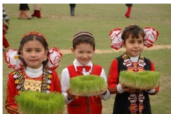
شکل ۲۸- جوانه های سبزه، نمادی از آغاز بهار در ترکمنستان