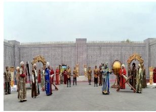
شکل ۱۰- برگزاری نوروز به شکل عمومی در ترکمنستان