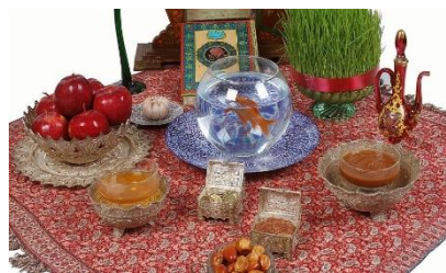
شکل ۱۷- سفره هفت‌سین ایرانی