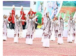
شکل ۱۱- چادر های عشایری بورت یا اوی در مراسم های نوروزی ترکمنستان