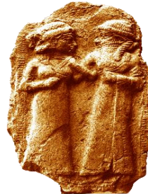
شکل ۲- نقش برجسته‌ای از ازدواج دُموزی (ایزدگیاهی در اسطوره سومری) با اینانا (الهه باروری)

ترکمن‌ها بر اسطوره‌های قدیمی معتقدند که در ادبیات فارسی کلاسیک نیز مشهود است. بر طبق این اسطوره و در کیهان شناسی قدما، زمین بر روی شاخ گاوی قرار گرفته بود و گاو در پشت ماهی، در دریای هستی شناور بود. هر سال هنگام نوروز گاو کره زمین را از شاخی به شاخ دیگر منتقل می‌کند تا خستگی سال گذشته را برطرف نماید به همین ترتیب در شهر عشق آباد میدانی وجود دارد که جلوه‌گر این افسانه قدیمی به روایت ترکمنی آن (شکل ۳) در عصر امروز است (نجان‌نوبری، ۱۳۹۷، ۳۲۲ و بهادر، ۲۰۰۸). مرور و توریق تاریخ نوروز، خاطر نشان می‌کند که طبیعت و پدیده‌های پیرامون آن، همواره در نزد انسان جایگاه ویژه‌ای داشته و رفته‌رفته سبب شکل‌گیری ذهنیاتی شده است که نسل به نسل و سینه به سینه چرخیده، انسان‌ها را گرد هم آورده و بنیان‌های شکل‌گیری مناظر آیینی را فراهم کرده است (شکل ۴).