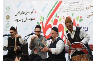
شکل ۵- برگزاری اجرای زنده موسیقی محلی در نوروزگاه بلوار کشاورز تهران