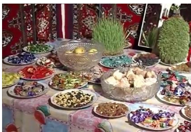
شکل ۱۸- سفره نوروزی ترکمنستان

در ترکمنستان نیز در پی گرامی داشت جشن نوروز، برپایی سفره‌های نوروزی که به آن «دست‌رخان» می‌گویند مرسوم است. سمنو، سفره، آیینه و شیرینی از عناصر ثابت چیدمان نوروزی ترکمن‌ها هستند (شکل ۱۸) و آن‌ها نیز برای سفره خود سبزه می‌رویانند که آن را نمادی از فرا رسیدن بهار می‌پندارند. زنان پیش از تحویل سال انواع شیرینی‌های محلی از قبیل، بیشمه، بورک، قاتلاما، پتیر، پسیق و سمنو را برای سفره خود آماده می‌کنند. حرمت پیران در این سرزمین بسیار زیاد است بنابراین دعای بزرگان خانواده در هر سفره نوروزی امری ضروری است و تا دعا خوانده نشود کسی دست به سفره نمی‌برد. آنها بر سفره می‌نشینند و بزرگان برای همگان دعا می‌کنند و سپس دست‌ها را بر صورت می‌کشند و جشن می‌گیرند (بهادر، ۲۰۰۸).