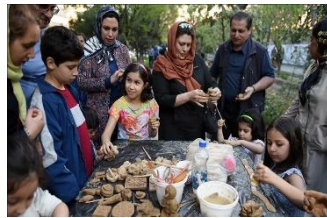
شکل ۸- بازی کودکان در نوروزگاه بلوار کشاورز تهران