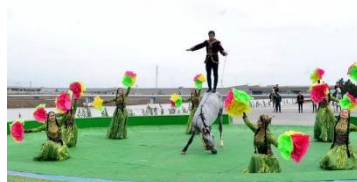
شکل ۲۴- اسبدوانی در نوروز کشور ترکمنستان