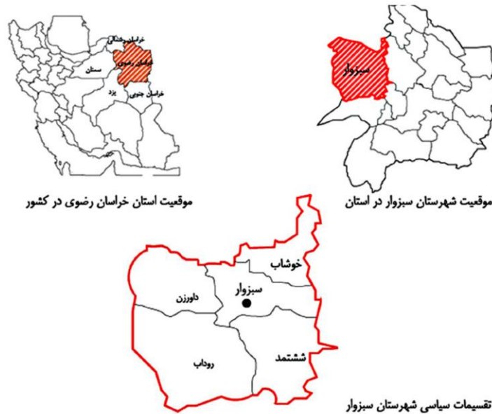
تصویر ۱: موقعیت شهر سبزوار، ماخذ: (وزارت کشور، ۱۳۹۰)

شهر سبزوار واقع در استان خراسان رضوی و مرکز شهرستان سبزوار است. این شهر که اکنون از لحاظ جمعیت و تجارت پس از مشهد بزرگترین و مهمترین شهر استان است، که در غربی ترین ناحیه این استان قرار دارد. این شهر در مسیر ارتباطی اصلی تهران- مشهد قرار گرفته است (زنگنه، ۱۳۸۱).