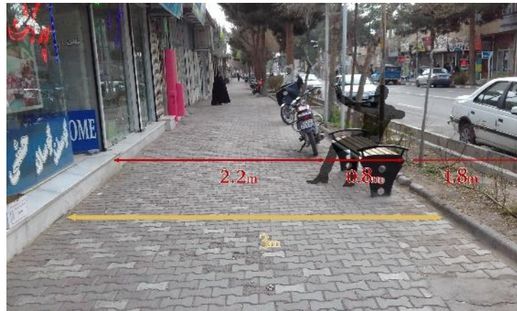
تصویر ۴: قرار گیری اشتباه نیمکت ها در پیاده رو

نیمکت ها و صندلی های خیابانی که در گذرگاه و محل تردد پیادگان قرار می گیرند، نباید مزاحمتی در رفت و آمد مردم ایجاد کنند و بیش از اینکه استفاده کننده، مردم و ترددشان را نظاره کند، نیمکت باید طوری موقعیت دهی شده باشد که فرد، طبیعت و منظر اطراف را مشاهده کند (شهرداری ها، ۱۳۷۹). همواره در مکان یابی محل های نشستن می بایست دقت نمود تا علاوه بر فراهم کردن آسایش کاربر، از ایجاد مزاحمت برای سایر افراد نیز جلوگیری شود (لحمیان و دیگران، ۱۳۹۲). همواره در مکان یابی محل های نشستن می بایست دقت نمود تا علاوه بر فراهم کردن آسایش کاربر، از ایجاد مزاحمت برای سایر افراد نیز جلوگیری شود (لحمیان و دیگران، ۱۳۹۲).