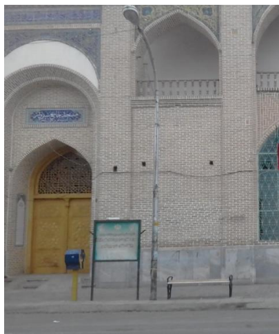
تصویر ۶: طرح نامناسب نیمکت در مجاورت مسجد جامع شهر، ماخذ: (نگارنده)

همانطور که بیان شد خیابان بیهق در بافت تاریخی شهر قرار داشته و به نوعی اولین خیابان شهر محسوب می گردد که در دوره پهلوی اول از میان بافت در هم تنیده شهر بیرون کشیده شد. در این خیابان، بناهایی مانند مسجد جامع شهر، بارگاه امام زاده یحیی، مسجد پامنار و چندین بنای تاریخی دیگر قرار دارد. نیمکت های نصب شده از لحاظ کالبدی هیچگونه هماهنگی با گذشته و حال این خیابان ندارد و همچون عنصری اضافی به اجبار در آن گذاشته شده است.