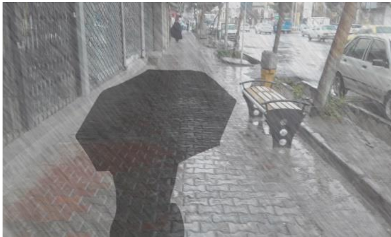
تصویر ۸: در امان نبودن از شرایط جوی، ماخذ: (نگارنده)

در طراحی و جایگذاری نیمکت ها هیچ توجه ای به اصول اقلیمی منطقه نشده است. با توجه به گرم و خشک بودن اقلیم منطقه، هیچ فکری برای حل آفتاب سوزان تابستان نشده است و همچنین در فصول بارش، نیمکت های نصب شده به طور کامل در معرض بارندگی می باشند. از لحاظ اقلیمی استفاده از این نیمکت ها تنها در شرایط مساعد بودن آب و هوا امکان پذیر است.