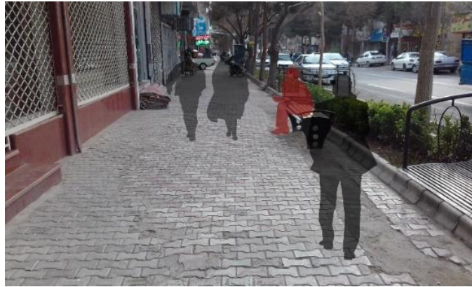
تصویر ۳: انسداد مسیر عابر پیاده

صحیح و انتخاب نادرست محل قرارگیری نیمکت ها باعث شده بخشی از فضای پیاده رو اشغال گردد. به شکلی که نیمکت و شخصی که بر روی آن نشسته، بخشی از پیاده رو را اشغال نموده و مانعی برای تردد می باشد. با توجه اینکه این خیابان، مهم‌ترین خیابان شهر بوده و بازار اصلی شهر در آن قرار دارد، رفت و آمد گسترده عابرین پیاده در آن انجام می شود. و این مسئله، مشکل را حاد تر می نماید.