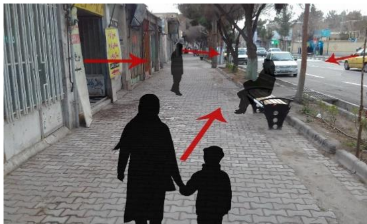
تصویر ۷: مشرف بودن نیمکت ها از تمام جوانب، ماخذ: (نگارنده)

جایگذاری نیمکت ها به شکلی می باشد که به طور کامل از تمام جهات دید کامل دارد و علاوه بر عابران، راکبان خودرو ها و فروشندگان نیز دید مستقیم به آن دارند. شکل قرارگیری به گونه ای است که هنگام استفاده، فرد مورد نظر در کانون توجه قرار می گیرد. با توجه به فرهنگ ایرانی اسلامی و اهمیت مسئله محرمیت و گذشته از آن مسئله خلوت در روانشناسی محیطی، می توان این موضوع را مشکلی مهم دانست.